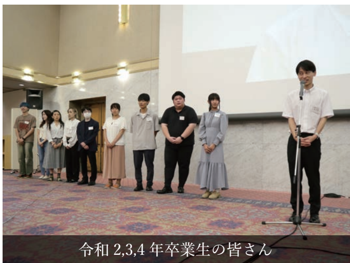
令和2,3,4年卒業生の皆さん