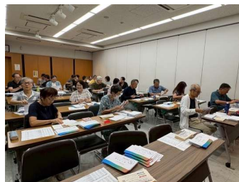
8月3日、品川区にて案内状の発送作業

当日は、市ヶ谷駅から会場までの誘導、お土産の準備、参加者受付、寄付金受付など、準備された分担表やマニュアルを基に3学年が協力して役割を担いました。